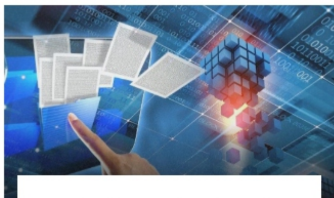
یک حساب کاربری ایجاد کنید

در سه مرحله آسان به دنیایی در حال تغییر پیوندید